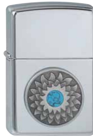
Turquoise Shield 310.058 #250 · 59,50 €