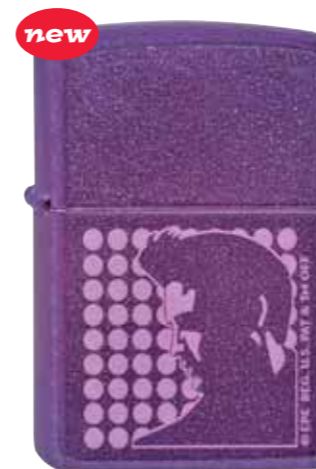
Elvis Silhouette 290.047 #21065 · 39,50 €