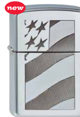
new Old Glory 410.106 #250 · 39,50 €