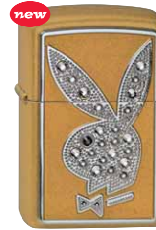
Playboy Bling 350.008 Gold Satin · 110,00 €