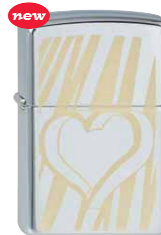
new Hearts / Slashes 410.107 #250 · 39,50 €