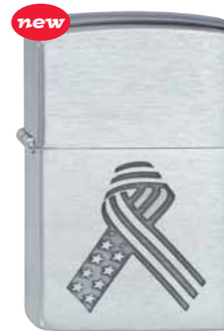
new Stars & Stripes Ribbon 100.130 #200 · 29,50 €