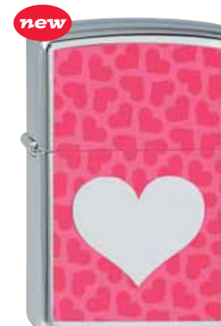
new Chromed Out Heart Pink 210.084 #250 · 39,50 €