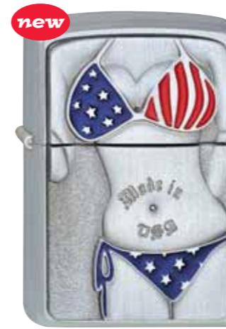
new American Vixen 320.045 #205 · 59,50 €