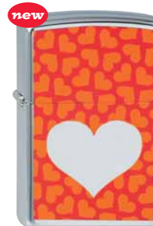
new Chromed Out Heart Orange 210.082 #250 · 39,50 €