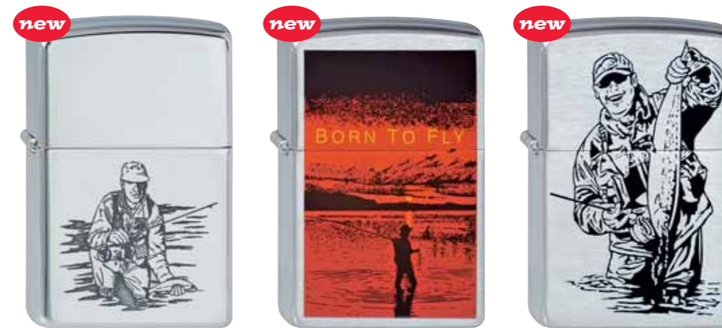
Fisherman No. 1 110.054 #250 · 33,50 €