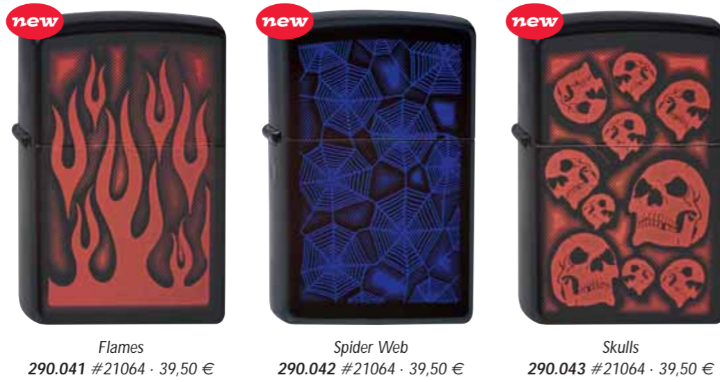
Flames 290.041 #21064 · 39,50 €