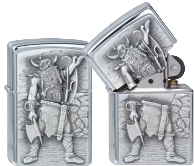
Conquerer 300.099 #200 · 39,50 €