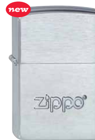
new Zippo Logo 430.007 #207 · 33,50 €