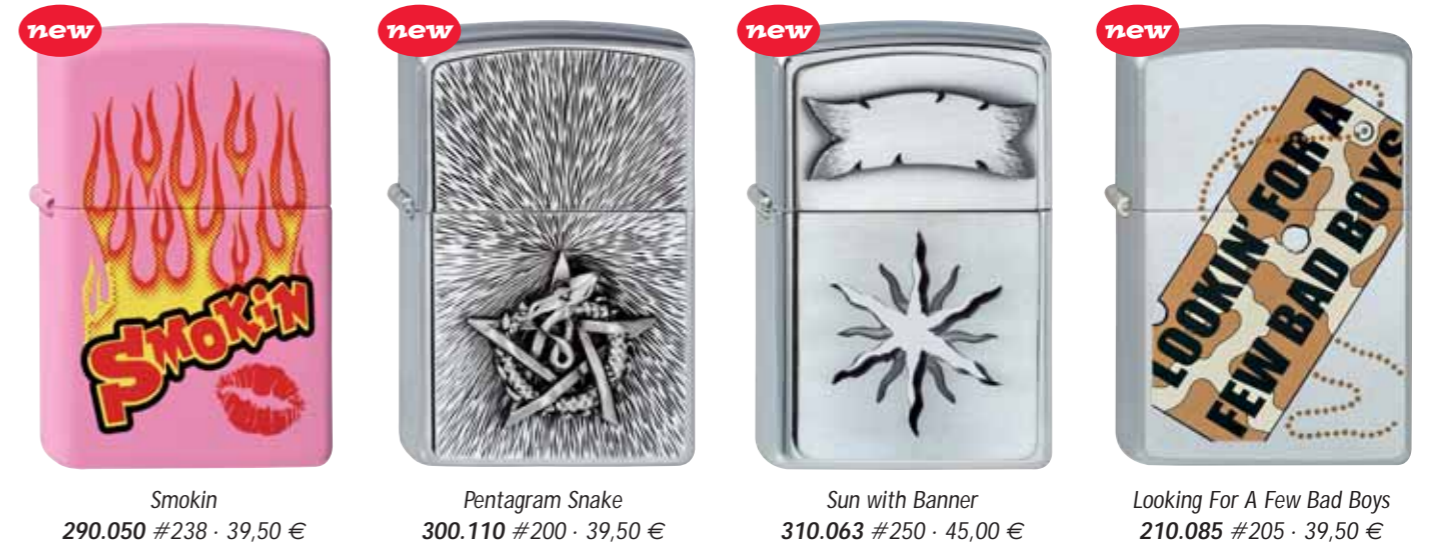
Smokin 290.050 #238 · 39,50 €