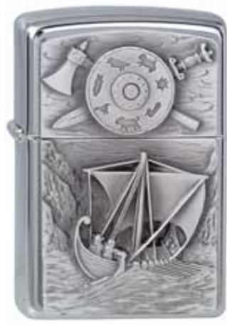
Viking Foray 300.094 #200 · 39,50 €