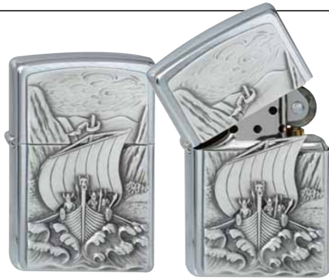
Viking Fjord 300.093 #200 · 39,50 €