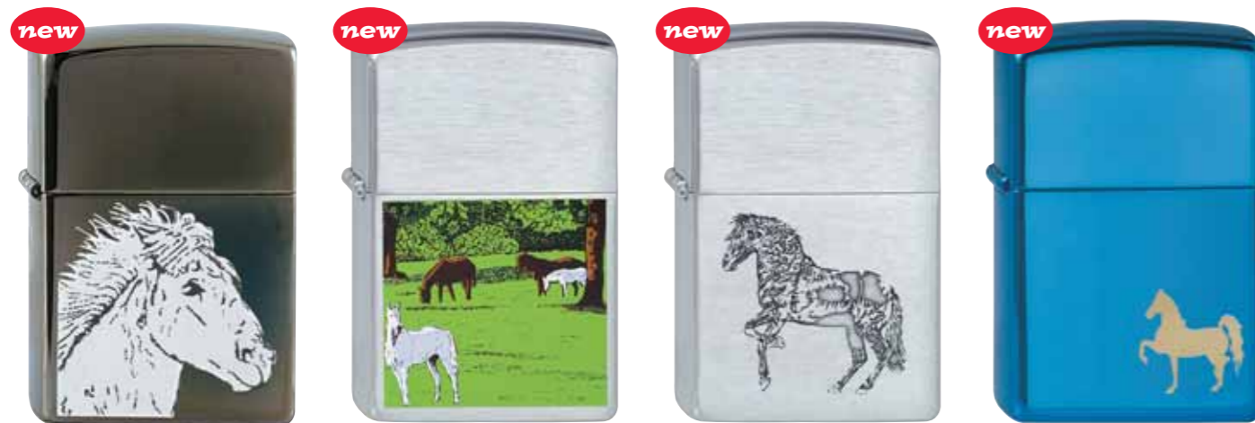
Horse 240.068 #150 · 45,00 €