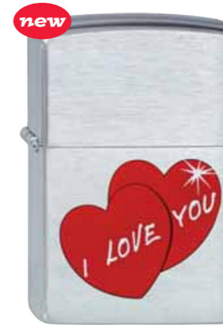
new I Love You 200.119 #200 · 29,50 €