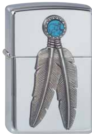
Feathered 310.056 #250 · 59,50 €