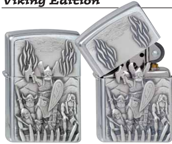
Warriors 300.092 #200 · 39,50 €