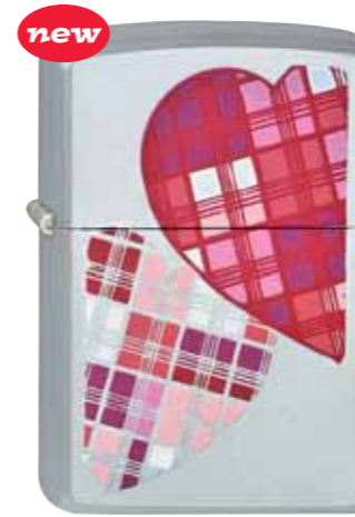
new Plaid Hearts 220.071 #205 · 39,50 €