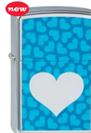
new Chromed Out Heart Turquoise 210.083 #250 · 39,50 €