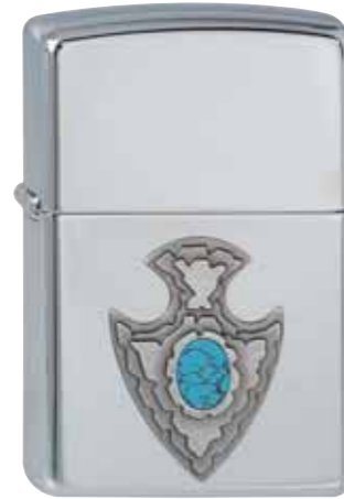
Blooming Turquoise 310.057 #250 · 59,50 €