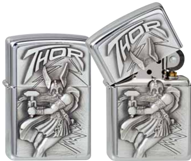
Thor 300.098 #200 · 39,50 €