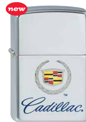
Cadillac 210.072 #250 · 39,50 €

Elvis and Elvis Presley are registered trademarks with the USPTO. © 2004 E.P.E. www.elvis.com