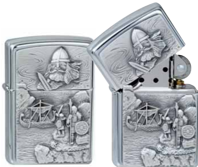
Viking Spirit 300.095 #200 · 39,50 €