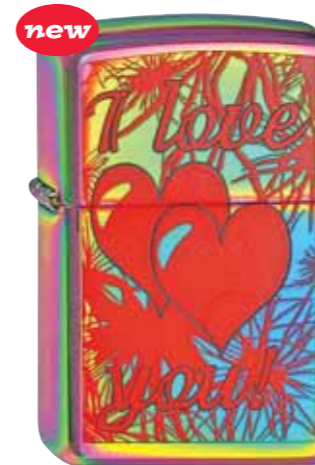
new I Love You 240.067 #151 · 45,00 €