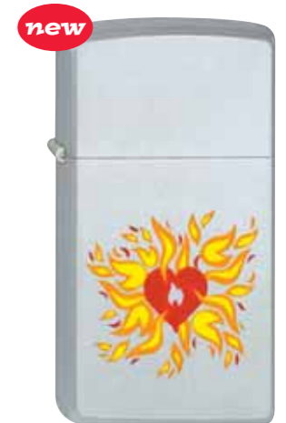
new Flaming Zippo Heart 270.020 #1605 · 29,50 €