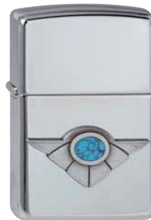
Winged Turquoise 310.059 #250 · 59,50 €